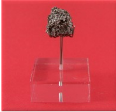
Ejemplar de platino

Destacar también que el Museo de Geología de la Universidad de Sevilla colaboró con la cesión de un ejemplar de Platino, mineral descubierto por Ulloa en Colombia y un "alambre de platino" que ya se usaba como material científico desde el Siglo XVII para el análisis químico por vía seca de minerales.